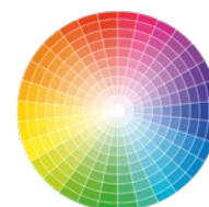
Alle RAL/NCS «matt glatt verlaufend»