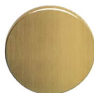
MEGA 20 Optik Messing hell patiniert, matt einbrennlackiert