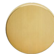
MEGA 230 Messing roh gebürstet, unbehandelt