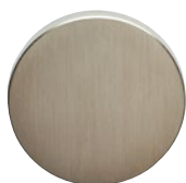
MEGA 01 gebürstet matt vernickelt

Die Grundmaterialien Messing und Zink eignen sich hervorragend um diverse Oberflächen gestalten zu können. Veredelte Metalloberflächen zählen zu den bedeutenden Ausdrucksmitteln der Architektur. Der einzigartige Finish vermittelt eine edle Dekoration, aber auch Nachhaltigkeit und feinste Handarbeit.