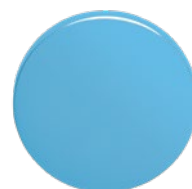
RAL 650-1 Cyan