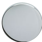
MEGA 04 poliert verchromt