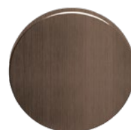
MEGA 40 Optik Messing dunkel patiniert, matt einbrennlackiert