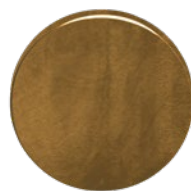
MEGA 70 Optik Messing Natur patiniert, matt einbrennlackiert