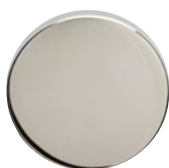
MEGA 03 poliert vernickelt