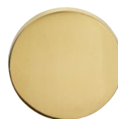
MEGA 06 Messing poliert lackiert