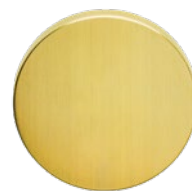
MEGA 220 Messing gebürstet einbrennlackiert