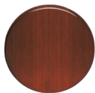
MEGA 60 Optik Kupfer mittel patiniert, matt einbrennlackiert