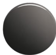
MEGA 100 Optik schwarz verzinkt, matt einbrennlackiert