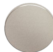
MEGA 07 gestrahlt