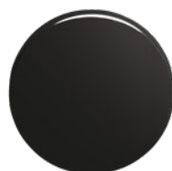
RAL 9005 Schwarz