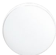
RAL 9010 Weiss

Für unsere qualitativ hochstehenden Beschläge bieten wir eine umfangreiche Farbpalette an Pulverbeschichtungen an. Ob Firmenfarbe oder Trendfarbe oder die Farbe zur Aktivierung von Gefühlen gewünscht wird – für sämtliche Ansprüche ist ein Farbton vorhanden.