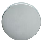
MEGA 02 gebürstet matt verchromt