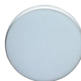
MEGA 05 velours verchromt