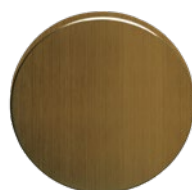
MEGA 30 Optik Messing mittel patiniert, matt einbrennlackiert