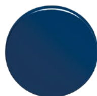
RAL 640-6 Blau