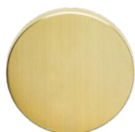
MEGA 10 Optik Messing gebürstet, matt einbrennlackiert

Für hochwertige Objektausstattungen ist «vintage» voll im Trend. Um eine einheitliche Optik zu vermitteln, werden Tür- und Fensterbeschläge in sehr anspruchsvollen Oberflächen gefertigt.