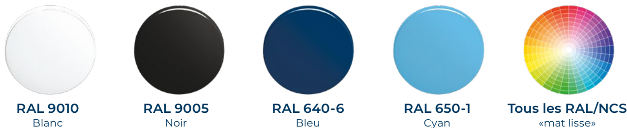
RAL 9010 Blanc

Pour nos garnitures de haute qualité, nous proposons une large gamme de couleurs de revêtement en poudre. Qu'il s'agisse de la couleur de l'entreprise, de la couleur préférée, de la couleur tendance ou même d'une couleur pour activer des sentiments, il existe une teinte pour chaque exigence.