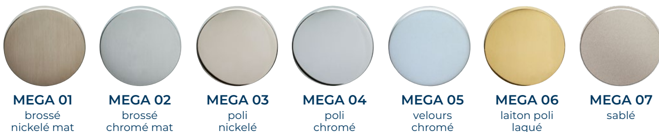
MEGA 01 brossé nickelé mat

Les matériaux de base, comme le laiton et le zinc, sont idéaux pour créer diverses surfaces. Les surfaces métalliques raffinées sont l'un des principaux éléments expressifs de l'architecture moderne. La finition unique, grâce au travail manuel le plus fin, confère une décoration noble, et durable.