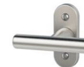
41.403 Rosace modulaire