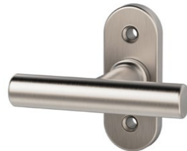
41.403 Rosace modulaire