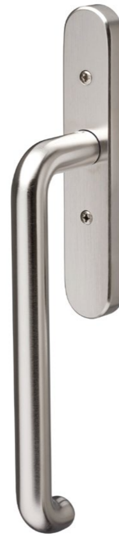
41.430 Rosace modulaire