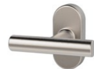
41.405 Rosace modulaire