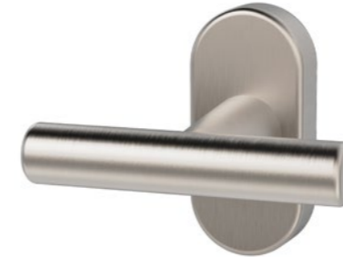
41.405 Rosace modulaire