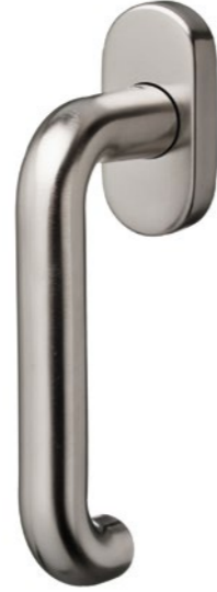
41.405 Rosace modulaire