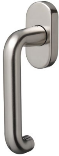
41.405 Rosace modulaire